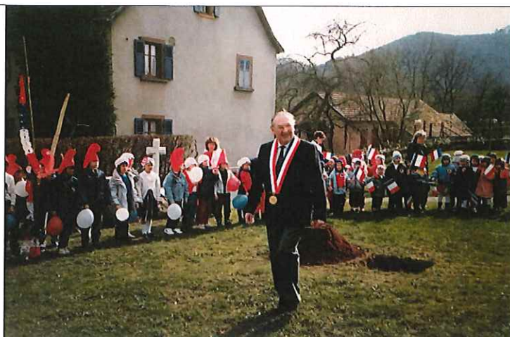
Plantation de l'arbre de la Liberté en 1989