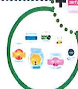
Pots en verre