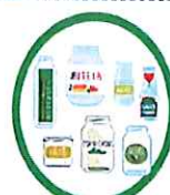
Bocaux en verre