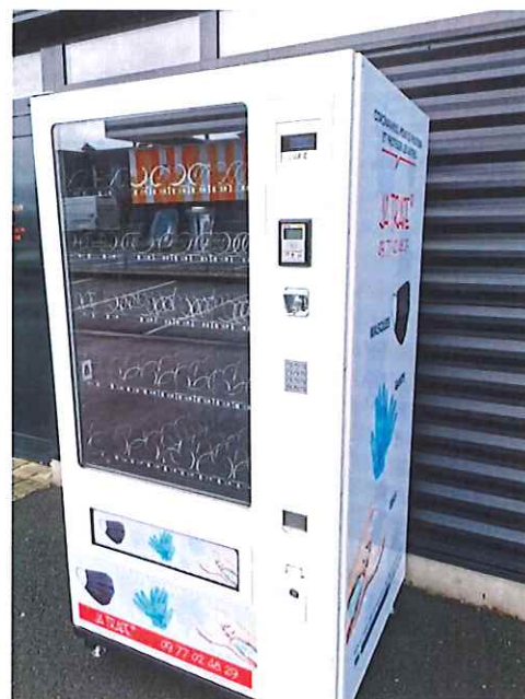
Ci-dessus, distributeur de masques et de gel hydroalcoolique implanté à Barenthal

Tél. 09 77 02 48 29 / Fax 03 88 72 03 45 jatrade@orange.fr