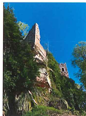
Le château du Grand-Arnsbourg

L'en-cours de la dette au 1 er janvier 2022 est de 975.505,80 €. Il intègre également l'emprunt en cours sur le camping et ramènera la dette par habitant à 1.149,03 € au 31 décembre 2022 (1.255,48 € actuellement). Il n'est pas tenu compte dans cet endettement du prêt relais de 120.000 € qui arrivera à échéance en fin d'année et sera entièrement remboursé sur l'exercice.