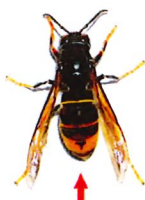
Frelon asiatique (taille réelle 3 cm)

En cas d'urgence avérée (danger immédiat pour la sécurité publique), c'est la commune qui fera procéder à la destruction d'office.